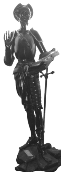
Рис. 7. Дон Кихот

Знаменитый Дон Кихот (рис. 7), масса отливки 19 килограммов, высота 730 мм, является особым экспонатом, поскольку был подарен профессору Дорошенко сотрудниками кафедры на его 50-летний юбилей.