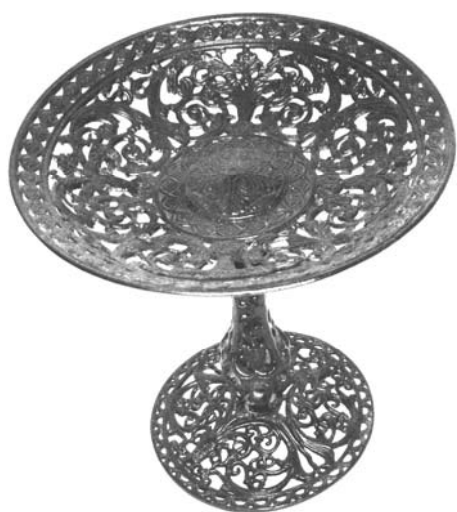
Рис. 6. Ажурная ваза

Ряд отливок из коллекции профессора еще при его жизни был задействован в практическом курсе художественного литья для студентов специальности.