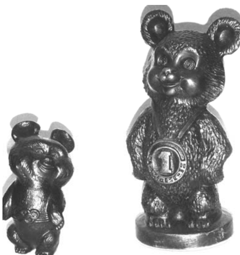
Рис. 4. Олимпийские мишки