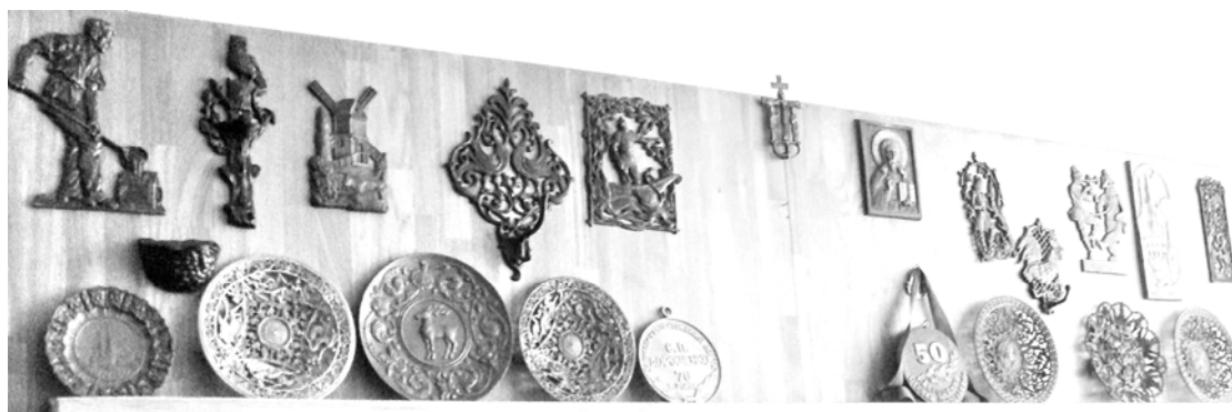
Рис. 5. Стенд с отливками