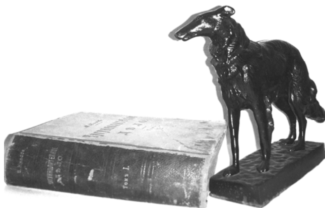
Рис. 2. Собака с антикварной книгой

В обустройстве музея приняли участие все сотрудники кафедры литейного производства и её выпускники, которые безмерно уважают и любят своего Учителя. Значительный объем организационной работы проделал воспитанник кафедры Г. З. Затульский.